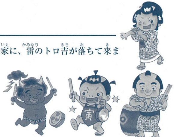
イラスト：中西らつ子

天神祭に近いある日、太鼓職人のひとり息子寅ちゃんの家には、雷のトロ吉が落ちて来ました。大鼓を上手に打って雲を呼び、早く天に帰りたいと泣くトロ吉。ところが肝心の太鼓の腕前は情けないものでした。そこで寅ちゃんとおとうちゃん、そしておかあちゃんが協力して太鼓打ちの特訓をはじめます。