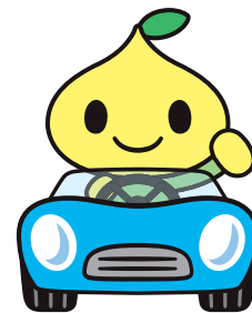
全労済公式キャラクター ビットくん