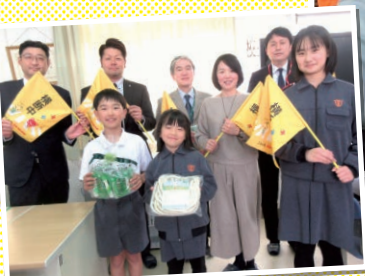
鹿児島／小学校への 横断旗の寄贈