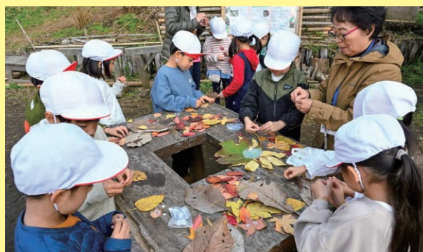
神奈川／名瀬谷戸の会 環境教育