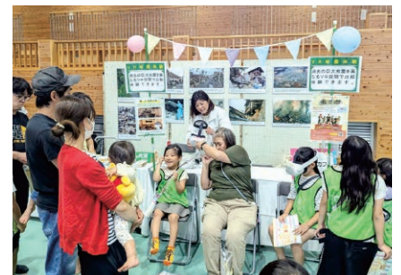
沖縄／結フェスタ2024でのぼうさいカフェ出展