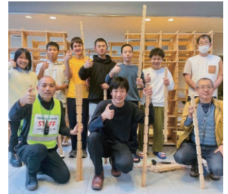
令和6年能登半島地震災害復旧支援（石川県）