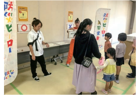
福井／防災・減災フェア2023の開催