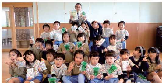
静岡／ なわとび・ 長なわ寄贈

2023年度は全国の児童館・保育園などへ81,966本を寄贈し、これまでの寄贈数は累計約254,000本となりました。