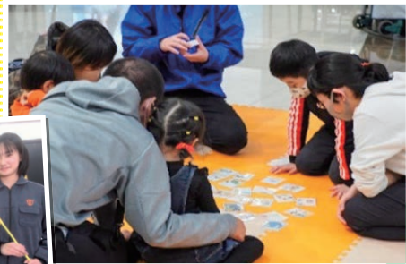
熊本／ 防災かるた 取り大会