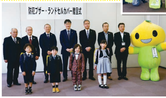
山口／自治体への 防犯ブザーの寄贈