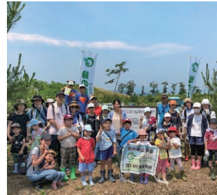
東日本大震災復興事業海岸林再生活動（宮城県）