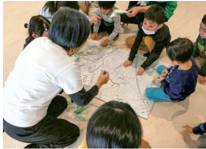
山形／防災ジオラマワークショップの実施