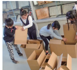
みんなでBosai×Eco CAMPでの防災工作

子どもたちの環境活動を応援する「こどもエコクラブ」を運営しており、当会は、子どもたちの防災力向上につなげる共創の取り組みとして、こどもエコクラブむけの活動メニュー「みんなでBosai×Eco CAMP（プログラム冊子）」の提供を行っています。