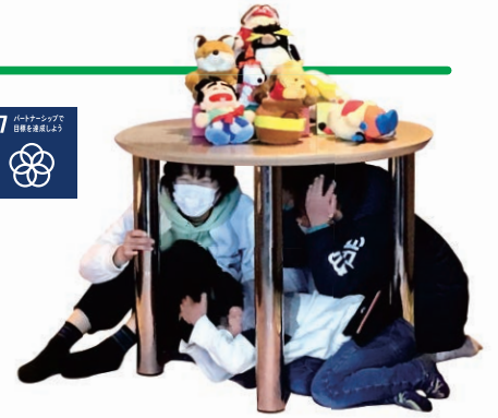
岩手／向中野・仙北防災体験学習

親子で災害を疑似体験できるブース出展や、気軽に楽しみながら学び実践できる防災工作など、さまざまな取り組みを実施しています。