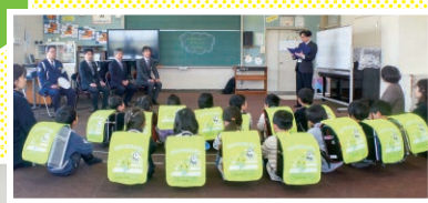
広島／ ランドセルカバー の贈呈