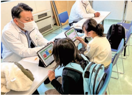
秋田／子ども向け映画上映会と防災・減災ブース出展