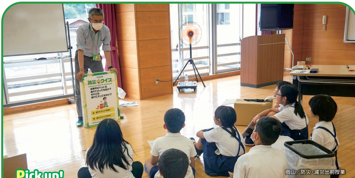
岡山／防災・減災出前授業

住まいの保障（火災共済）から事業を開始した当会が、これまでの災害対応の中で得た教訓と経験をもとに、さらなる防災・減災の普及とネットワークづくりを進めるため、2021年3月より「これからの防災・減災プロジェクト」を展開しています。もしもの保障（共済）による備えだけでなく、その前（被害の抑制）と後（復旧・復興支援、生活再建）の備えを、自助・共助・公助の観点で強化し、地域でのセーフティーネットづくりをすすめています。