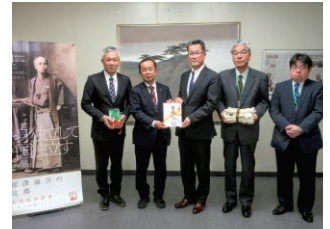
大分／なわとび・長なわ寄贈