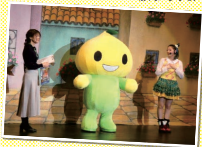
大阪／人形劇「しあわせの王子」の開催