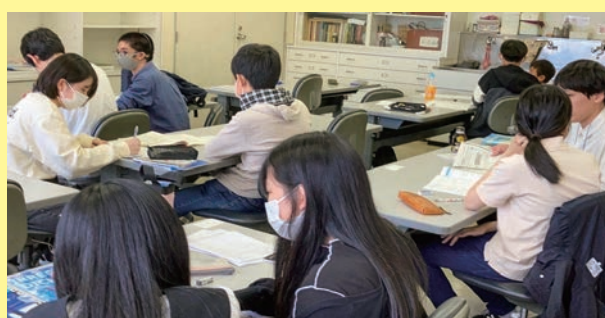
兵庫／神戸市職員有志 学習支援の実施