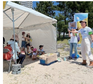
子どもたちによる海や砂浜の学習活動（全国砂浜ムーブメント）

* 砂浜ノートを用いて楽しみながら砂浜の大切さを学んだり、アプリを活用して気軽に生きもの調査やごみ拾いに参加する活動。