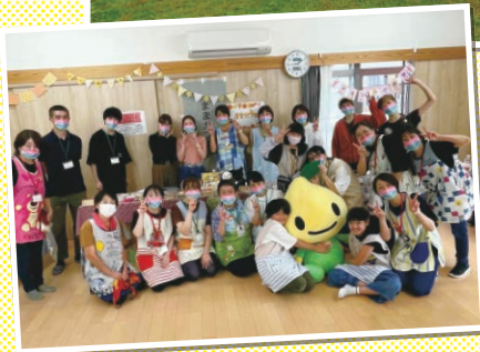
福島／子ども食堂との子どもの健全育成イベントの開催