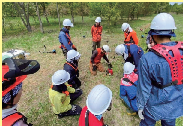
北海道／帯広の森サポーターの会 刈払機作業研修会