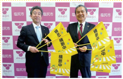
長野／自治体への横断旗の寄贈