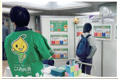
東京／交流フェスタ2023