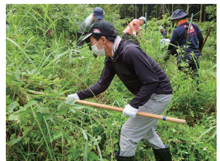
静岡／国際協同組合年記念植樹の保全活動