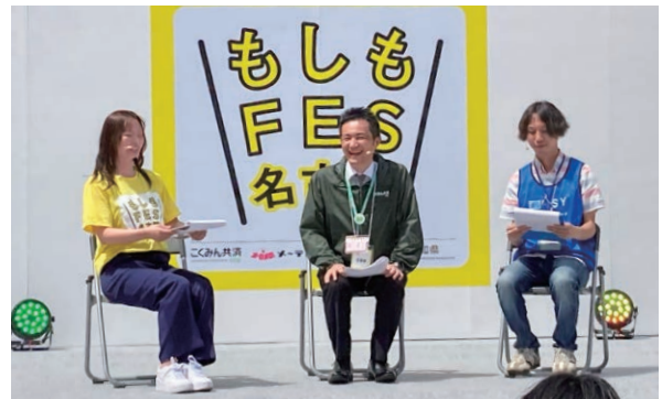
もしもフェス名古屋2024のステージの様子

2023年度もさまざまな企業、団体と連携し、「もしもフェス」を渋谷区と名古屋市で開催しました。家族で楽しみながら「もしも」の備えを体験できるブース出展やステージイベントを開催し、来場者の皆さまへ防災・減災の啓発活動を行いました。