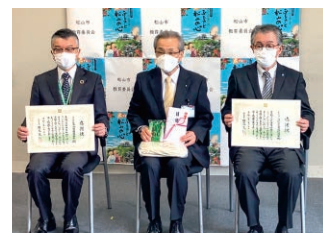
愛媛／なわとび・長なわ寄贈