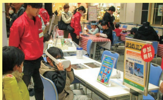
愛媛／イオンモールでのぼうさいカフェ出展