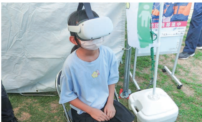
鳥取／とっとり防災フェスタでのVR地震体験

デジタル技術を活用し、映像と音で実際に現場で地震、台風、洪水被害に遭遇したようなVR体験やタブレットを活用した地盤診断サービス、自宅から気軽に参加できるオンライン防災・減災イベントを開催しました。実際の災害が起きた際の行動、備えにつなげています。