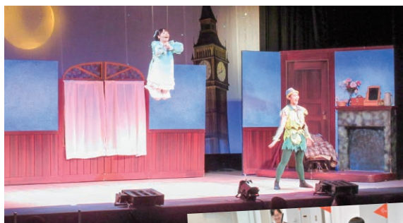
北海道公演／ 「ピーターパンとウエンディ」

「未来を担う子どもたちとご家族に、良質な文化芸術に触れ豊かな心を育んでいただきたい」との願いから、1992年より「文化フェスティバル」を継続的に開催しています。2023年度は、演劇、ダンスなどを上演しました。