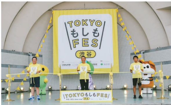
もしもフェス渋谷2023ステージの様子

もしも首都直下地震が起きたら、帰宅困難者は約500万人、食糧は3,400万食が不足するという被害予測があります。「もしもプロジェクト」は、一人一人が「もしも」の日のために何ができるかを考え、備えることで、レジリエントなまちづくりをめざす取り組みです。