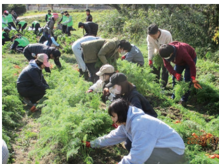
福岡／被災地復興支援活動