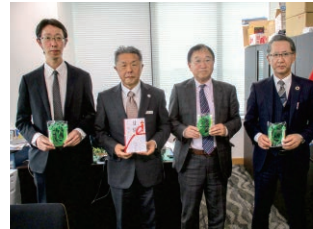
高知／なわとび・長なわ寄贈