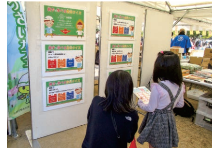
愛媛／生協まつりでの防災クイズ展示