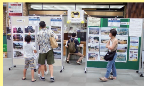
愛知／親子ぼうさいスタジアムの開催