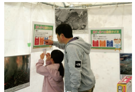
長崎／福祉まつりでのぼうさいカフェ出展