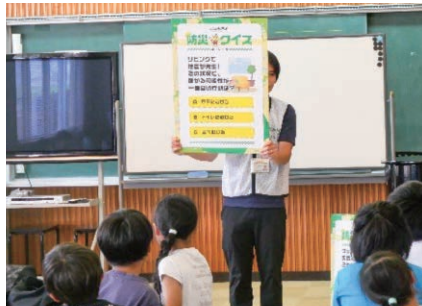
岡山／おかやまコープとの小学校でのぼうさいカフェ共催