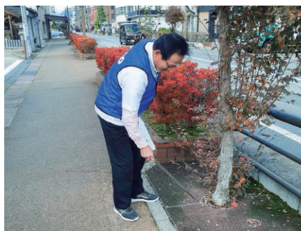
岐阜／飛騨高山古い町並み周辺の清掃