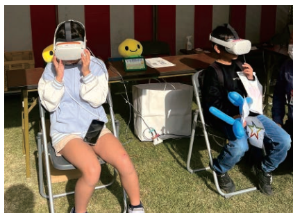
宮崎／生協まつりでのぼうさいカフェ出展