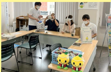
香川／ミニぼうさいカフェ出展

防災士は各地で安心のネットワークの核となるため活動を展開しています。今後も防災士の養成をすすめていきます。