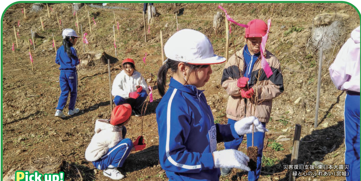
災害復旧支援:東日本大震災 緑と心のふれあい(宮城)