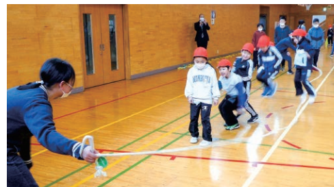
青森／ 寄贈した長なわで なわとび教室