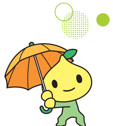
京都／体験型防災アトラクションの開催