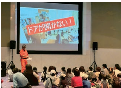
奈良／体験型防災アトラクションの開催