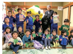
岩手／なわとび・長なわ寄贈