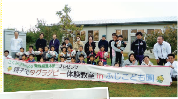
青森／親子を対象としたタグラグビーの実施