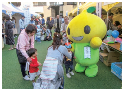
福岡／福岡市防災フェアでのぼうさいカフェ出展