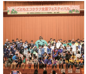
こどもエコクラブ全国フェスティバル