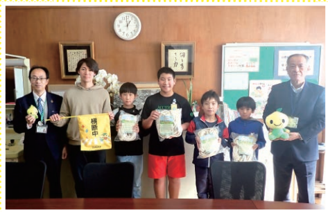
静岡／小学校への横断旗の寄贈