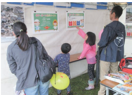
大分／メーデー会場でのぼうさいカフェ出展