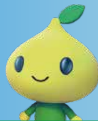
公式キャラクター ビットくん