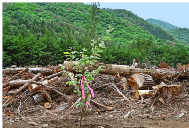
<地元植生であるミズナラ、ブナ、コブシ、ヤマザクラを植樹>