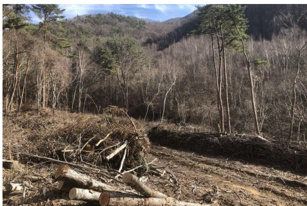
<笛吹市芦川町のカラマツ伐採跡地>

山梨県笛吹市芦川町は、富士山を望む美しい自然に恵まれる一方、若者の都市部への流出と少子化による人口減少により過疎化が進み、手入れが行き届かない人工林やカラマツの伐採跡地が増加しています。本活動では、こうした伐採跡地に100年先まで存続する豊かな水源林を再生することを目指し、地元植生であるミズナラ、ブナ、コブシ、ヤマザクラの広葉樹計2,000本を植樹します。