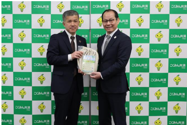
なわとび・長なわ寄贈の様子

今後も、未来を担う子どもたちが心身ともにすこやかに成長できる社会を願い、取り組みをすすめてまいります。