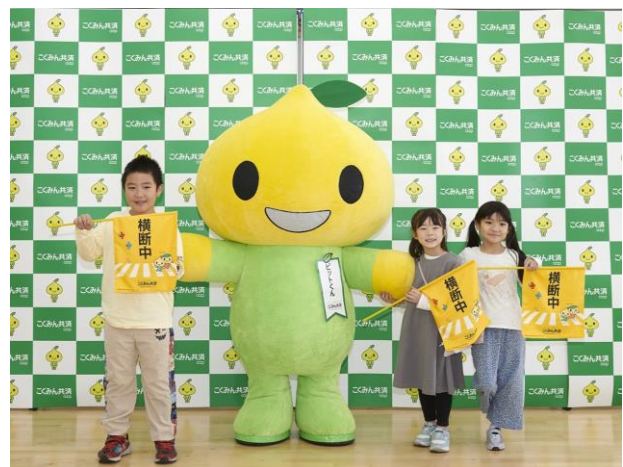
1 年生の代表者との記念撮影