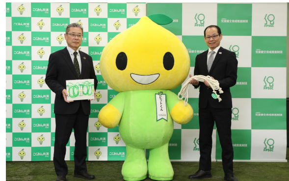
こくみん共済 coop 公式キャラクター ピットくんととの記念撮影