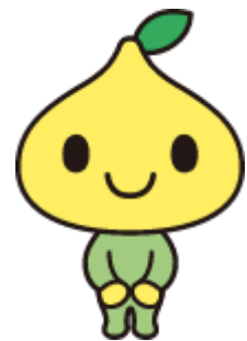
公式キャラクター ピットくん

<開催概要> 日時：2023年9月3日(日) 14:00～14:10 会場：代々木公園 ステージ会場 参加：無料/事前予約なし