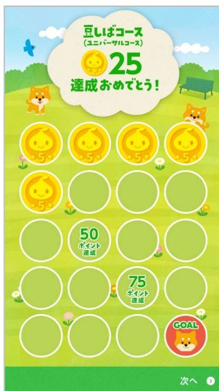
▲ユニバーサルコース (豆しばコース)