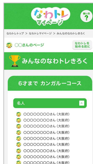
▲みんなのなわとレきろく