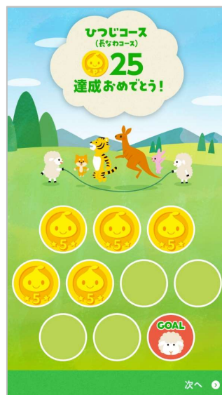
▲長なわコース (ひつじコース)