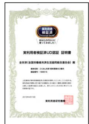
実利用者 ユニバーサルデザイン認証