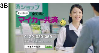
店員)いらっしやいませ