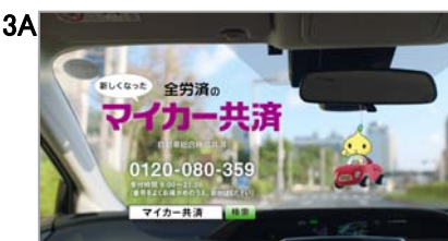
♪新しくなった マイカー共済