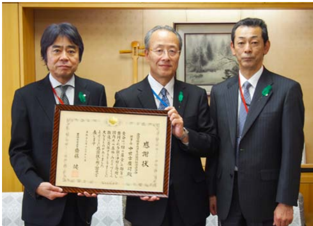
（中央）林野庁 沖修司長官 （左）全労済 中世古廣司理事長 （右）全労済 野崎一三経営企画部次長

今回の感謝状は、公益社団法人 国土緑化推進機構が実施する『「緑の募金」』使途限定募金（東日本大震災復興事業・平成28年熊本地震復興支援事業）への寄付など、募金総額1,831万円に対して贈られたものです。