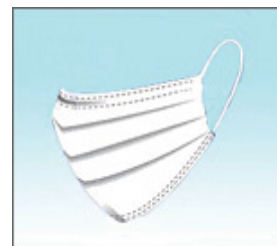
プリーツ型マスク

ちなみに、サージカルマスク（外科用マスク）は、医療用の不織布製マスクのことを指し、手術時に医療従事者の唾液等を患者の手術部位に飛ばさない等の目的で使用される。サージカルマスク（外科用マスク）は、新型インフルエンザ流行時の日常生活における使用においては、家庭用の不織布製マスクとほぼ同様の効果がある。