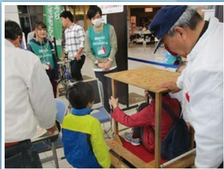
名古屋みどり 災害ボランティアネットワーク (愛知県)