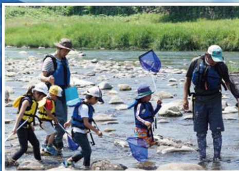
カワラバン(宮城県)