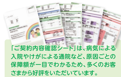
「ご契約内容確認シート」は、病気による入院やけがによる通院など、原因ごとの保障額が一目でわかるため、多くのお客さまから好評をいただいています。

こくみん共済 coop でご加入の保障を一覧にした「ご契約内容確認シート」をもとに、お客さまと一緒に保障点検を行っています。不足する保障や重複している保障をご説明することで、お客さまから感謝の声をいただいたときは、「お客さまのお役に立ててよかった」とうれしくなります。