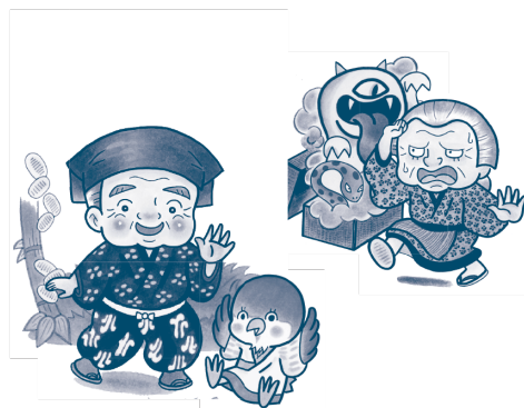
イラスト：中西らつ子

ご飯で作った糊を子雀に食べられてしまったお竹ばあさんは、腹を立てて子雀の舌を切ってしまいます。それを聞いた善兵衛じいさんが裏山へ行き、親雀に謝ると、親雀は宝が入った葛籠をくれました。これを聞いたお竹ばあさんが、自分も宝が欲しいと雀に頼むと……？