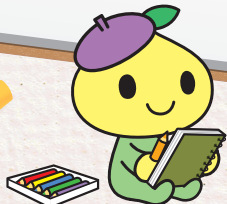
公式キャラクター ビットくん