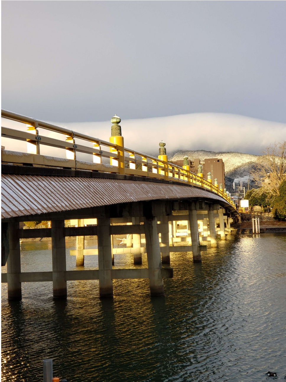
黄金の唐橋（小川 進也）