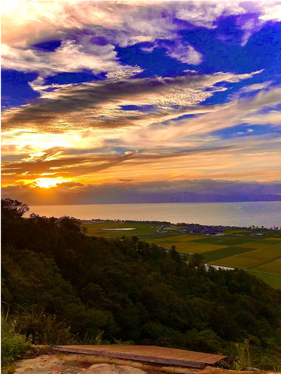
荒神山からこんばんは（たいき）